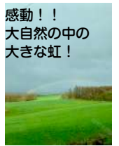
感動！！ 大自然の中の 大きな虹！

滞在先のマンションは、札幌市中心街から少し離れた静かな場所で、部屋からの眺めも良くとても快適に過ごせました。