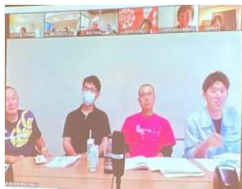
【庄内みどり生産者の皆さん】