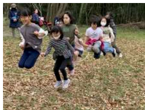
【子どもたちは 外遊びに夢中】

年間目標 25人 当月純増 1人 (期首累計▲4人) 組合員 390人 (6月末実績)