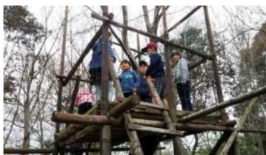
【滋賀の皆さんと一緒に記念撮影】