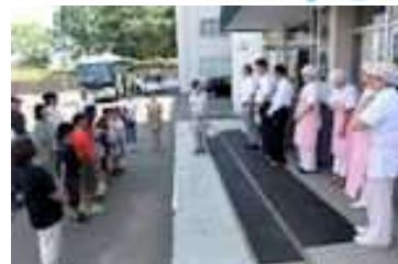
JAカレッジの皆さんと涙のお別れ