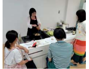
味噌の香ばしい香りがたまらない！