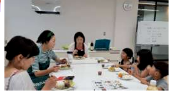
ちびっこにも大好評！