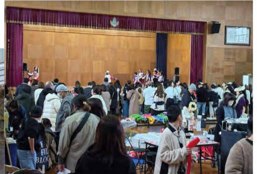
会場の様子。たくさんの方が訪れています。ステージ発表のダンスや太鼓もマルシェを盛り上げました！

○出店者の方にも声をかけたところ、9月に加入予定だったが諸事情により断念されていたという方に出会い、加入したかった！とのことで加入につながりました。待ちの姿勢だけではなく、自ら声掛けをしていくことの大切さを改めて実感しました☆☆☆