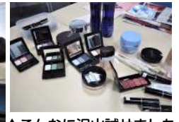
↑こんなに沢山試せました