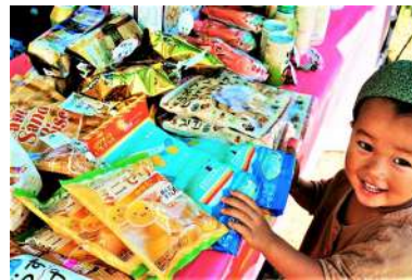
こんなにたくさんの 消費材にこぼれる笑顔(^_^) 大盛況でしたよ~!