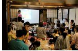
夜間の開催 でしたが、 こんなに たくさん の方々が 大集合