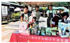
↑笑顔のスタッフ！ がんばりました！

熱中症になりそうな暑さの中、キャンドルライブが始まりました。ステージでは、子ども達の発表、フラダンス、ライブパフォーマンスなど盛りだくさん、大勢の参加者でした。生活クラブのブースでは、販売する消費材を増やして皆さんにアピールしました。