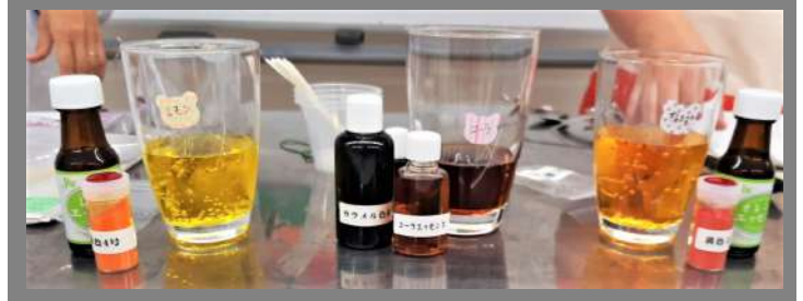
参加組員2名・スタッフ5名