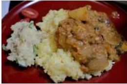
試食の夏野菜カレーとポテサラ！ ひき肉はもちろん平田牧場♪