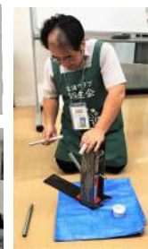
圧搾機でなたねをつぶすと…